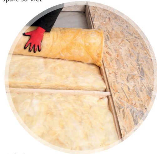
Abb. 1: Begehbare Dachboden

Um Wärmebrücken zu vermeiden, sollte sowohl auf eine Deckenranddämmung als auch auf ungedämmte Bodentreppen geachtet werden: Diese dann ebenfalls wärmedämmen oder ggf. austauschen (Kosten ca. 300 bis 600 Euro).