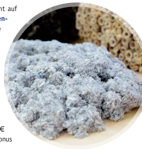
Abb. 4: Zellulose-Einblasdämmstoff

Sollten technische Gründe die Dicke der Dämmschicht begrenzen, gelten die Anforderungen des GEG auch als erfüllt, wenn die höchstmögliche Dämmschichtdicke eingebaut wird und der Dämmstoff eine Wärmeleitfähigkeit von 0,035 W/(m 2 K) aufweist. Kommt die Einblasdämmung oder Dämmmaterialien aus nachwachsenden Rohstoffen zum Einsatz, reicht eine Wärmeleitfähigkeit 0,045 W/(m 2 K) § 47 Abs. 2 GEG.