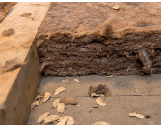
Abb. 2: Nicht begehbare Dachboden

Die Beratung und Durchführung durch einen Fachmann wird empfohlen, bei fachmännischer Handhabung dauert die Dämmung weniger als einen Tag, abhängig von der Größe der zu dämmenden Fläche.