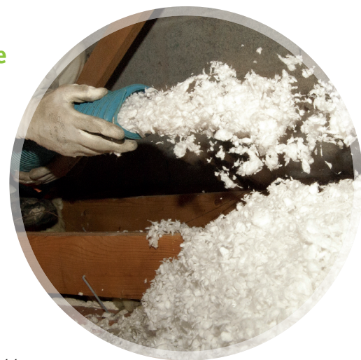
Abb. 3: Einblasdämmung